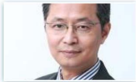
吴晓波 浙江大学管理学院院长 教育部长江学者特聘教授