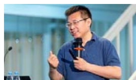
周立 清华大学经济管理学院会 计系教授

（接上页）和君商学模式已成为现代商学的成功典范。借助浙大教育平台，汇聚顶尖的资本、运营方面专家，融合国内外先进的理论和实践成果，将一流企业家和职业经理人召回课堂，在新知识、新思维的碰撞过程中，再度升华。