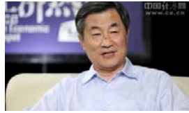
周放生 中国改革重要推动者之一 经济学家、风险管理专家