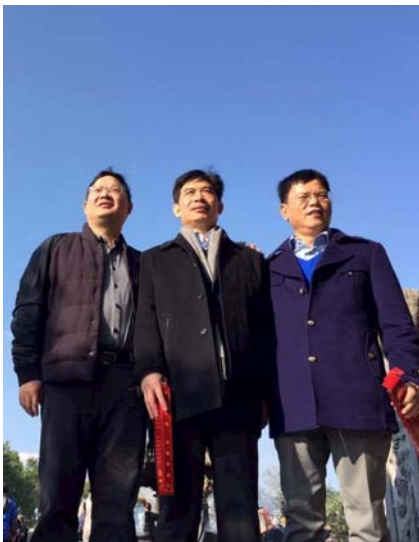
总裁班学员舟山游学祈福留念照