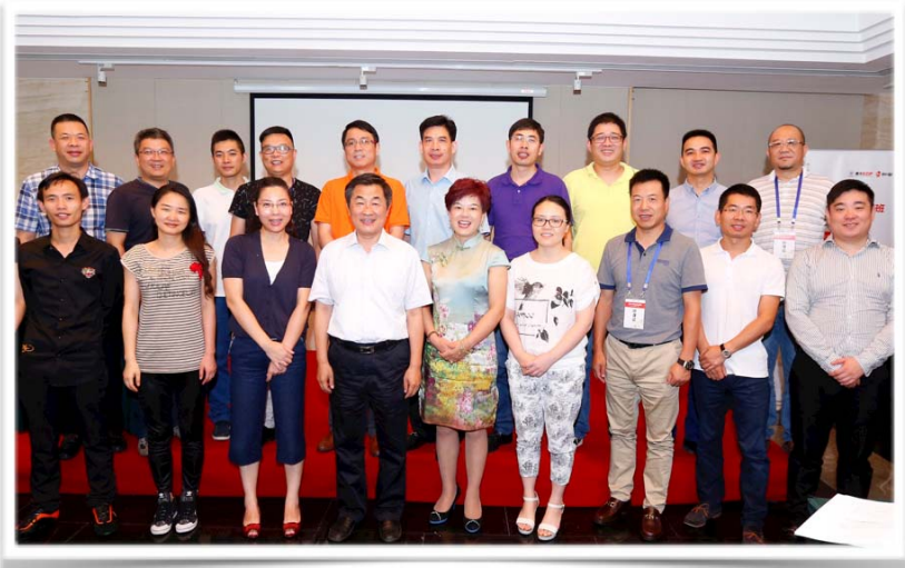
总裁班学员与老师合影留念照

本总裁班项目实现了“现场学习”与“在线学习”的同步，即企业领导者现场上课，企业中高层远程参加视频同步直播。以此，让团队跟上企业家节拍，帮助企业提高内部共识，加速企业思维转型。同时，结合和君的企业经营“产融互动”理念，我们将围绕总裁班体系，组织针对董秘、HRD、COO等企业关键高管的社群沙龙和培训成长计划，帮助企业的核心团队完成“上下同欲，知行合一”。