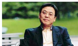
阎炎 软银亚洲信息基础投资基金总裁 软银亚洲投资基金首席合伙人